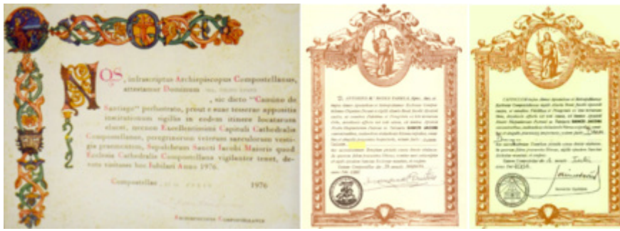
Les Compostella en 1976, 1982 et 2001